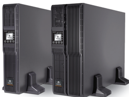
Liebert GXT4 700 - 3000 VA