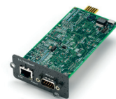
Коммуникационная карта Vertiv™ IntelliSlot®